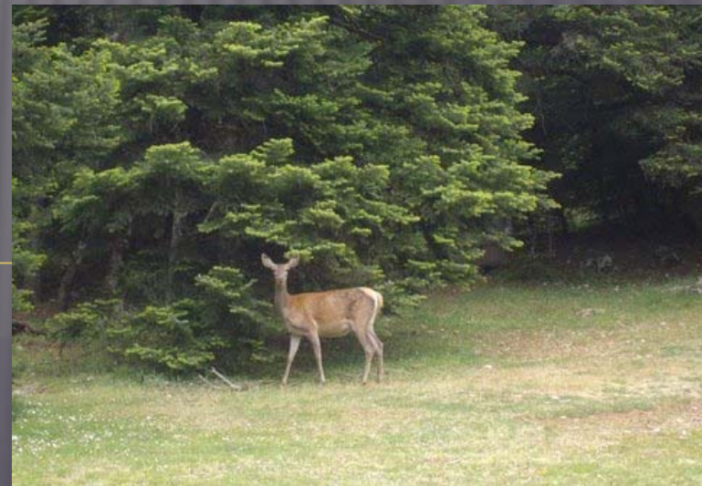
Εθνικός Δρυμός Πάρνηθας