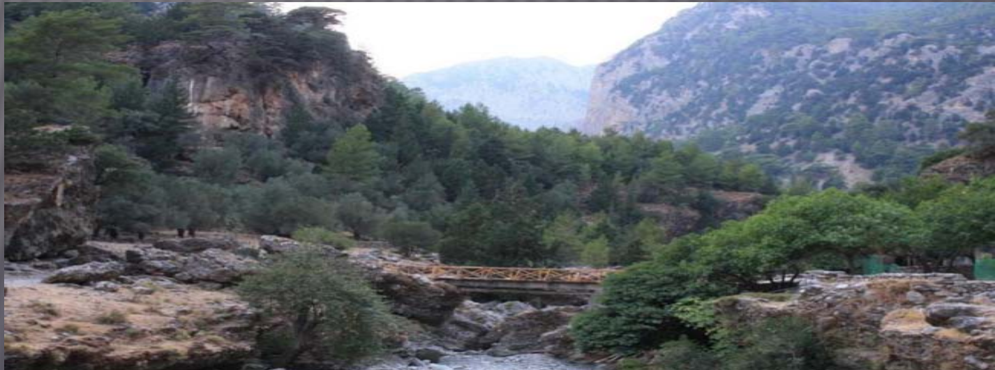
Εθνικός Δρυμός Σαμαριάς

α) Δάση και δασικές εκτάσεις που παρουσιάζουν ιδιαίτερο επιστημονικό, αισθητικό, οικολογικό και γεωμορφολογικό ενδιαφέρον ή περιλαμβάνονται σε ειδικές ζώνες διατήρησης και ζώνες ειδικής προστασίας (εθνικοί δρυμοί, αισθητικά δάση, υγροβιότοποι, διατηρητέα μνημεία της φύσης, δίκτυα και περιοχές προστατευόμενα από τις διατάξεις του κοινοτικού δικαίου, αρχαιολογικοί χώροι, το άμεσο περιβάλλον μνημείων και ιστορικοί τόποι).