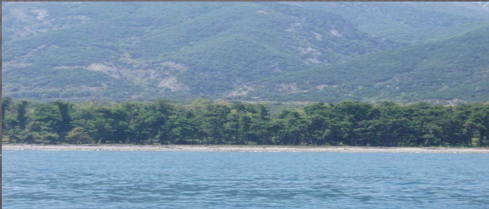
Δάσος Σκλήνθου / νήσος Σαμοθράκης

β) Δάση και δασικές εκτάσεις κείμενες επί ζώνης πλάτους 1.000 μέτρων από της θαλάσσης, για όλες τις παράκτιες περιοχές της Χώρας (παραλιακά δάση), πεντακοσίων μέτρων γύρωθεν της όχθης των λιμνών (παραλίμνια δάση) και 200 μέτρων εκατέρωθεν της όχθης των ποταμών.