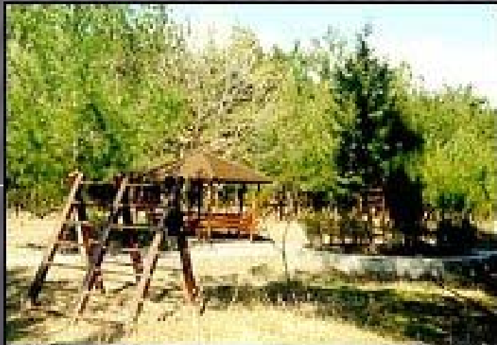
Δάσος Νυμφαίας και το τουριστικό περίπτερο

ε) Δάση και δασικές εκτάσεις που βρίσκονται γύρω από αρχαιολογικούς χώρους, ιστορικούς τόπους, ή μνημεία ή παραδοσιακούς οικισμούς και σε ακτίνα τριών χιλιάδων (3.000) μέτρων από το κέντρο αυτών.