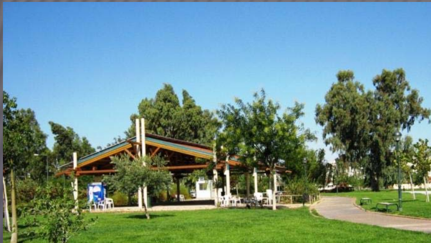
Πάρκο στο δήμο Βριλησίων

α) Πάρκα και άλση εντός των πόλεων ή των οικιστικών περιοχών.